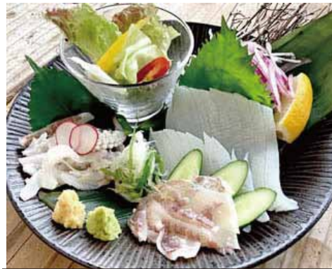
剣先イカ霜造り 2520円(込)