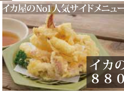
イカの天ぷら 880円(込)