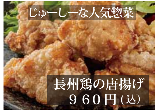
長州鶏の唐揚げ 960円(込)