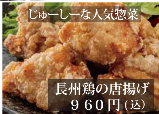
長州鶏の唐揚げ 960円(込)