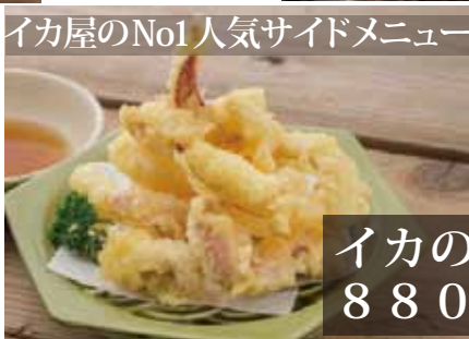
イカの天ぷら 880円(込)