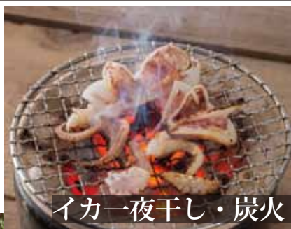
イカ一夜干し・炭火

表面をさっと湯に通し、 食感と旨味を引き上げる。 スリットを刻み入れ、細く 切った身が、舌の上で旨味 をより多く感じやすくさせ る細工。味わいに重きを置 いた剣先イカ専門店ならで はこのこだわりのハイブリッ ドなイカ刺しです。