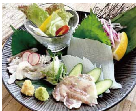
剣先イカ霜造り 2520円(込)