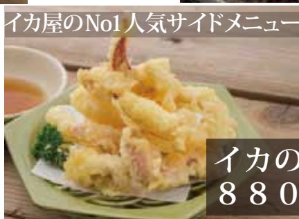
イカの天ぷら 880円(込)