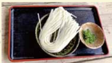
米粉麺(フォー) × 1個