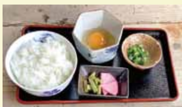
雑炊セット × 1セット

※無料の追加オプションで、「米粉麺(フォー)」か「雑炊セット」を、いずれか各1セット選べます。