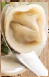
水餃子1個入っています。

あざりと魚醬の海鮮スープ出汁に、イカとセロリとトマトが抜群の相性。仕上げのEXVオリーブオイルの香りが鼻孔をくすぐります。地元農家さんの無農薬米粉麺でフオーのように楽しめる、優しい味わいが毎朝食べたくなるヘルシー感です。