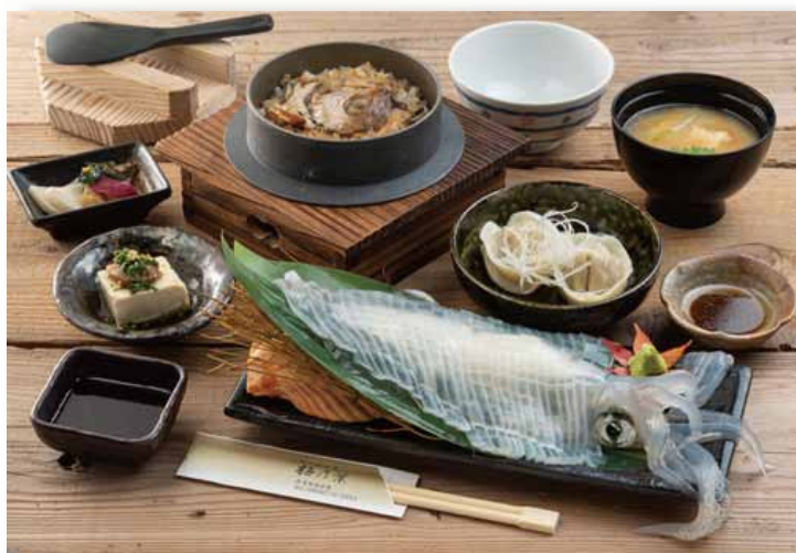
要 25分 【アツアツ炊きたて】【ピチピチ捌きたて】