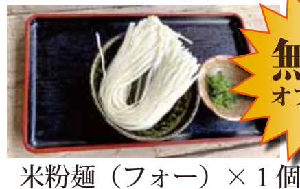
米粉麺(フォー) × 1個