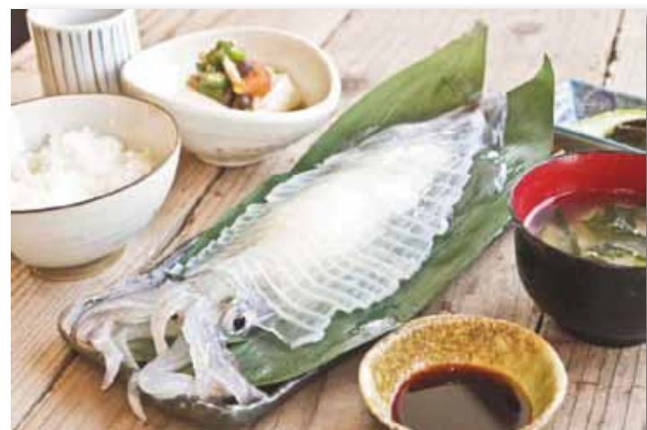
【ピチピチ捌きたて】

イカは低糖質・低脂質・高タンパクの滋養素材。「須佐男命いか」の活き造りと、「イカ水餃子」、「サラダ」、そして熟成発酵させた生姜酵素たっぷりの「生姜糍土鍋ごはん」で、イカを堪能しながら美味しく食べて健康に！店長おすすめ！