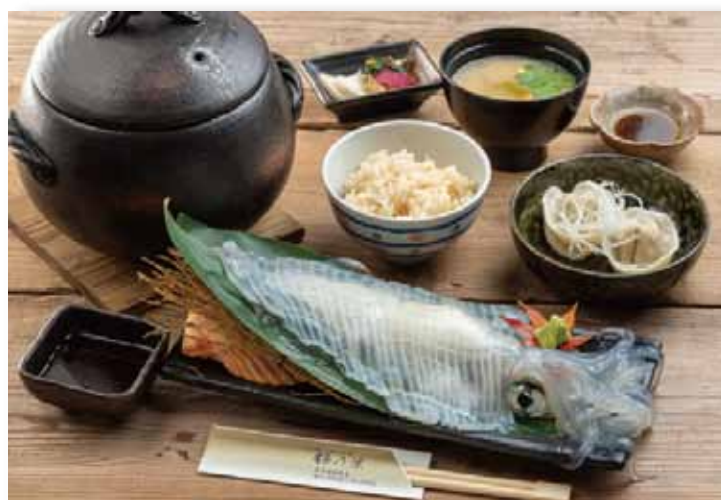
要 25分 【アツアツ炊きたて】【ピチピチ捌きたて】

「須佐男命いか」の活き造りと、東洋美人の酒粕をで発酵した「イカ味噌美人」の「イカ味噌豆腐」、肉汁たっぷりの「イカ水餃子」、「サラダ」そして「のどぐろ生姜釜飯」の、梅乃葉の味を堪能するセット！