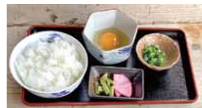
雑炊セット × 1セット

無料の追加オプションで、「米粉麺」(フォー)か「雑炊セット」を、いずれか各1セット選べます。